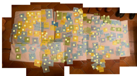
Représentation des méthodologies collectives de l'école du feu

NB : Création en cours - ces pièces ne seront pas forcément présentes sur l'exposition