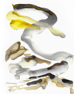
Encres de cendres, Garance Maurer