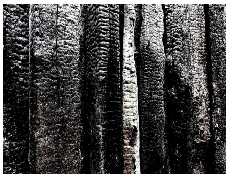
Les heures chaudes, Alain Arraez

📍 La Villa Mistral | Entrée libre | Visionnage et échanges autour des témoignages filmés avec les initiateurs de la démarche le 4 juillet (toute la journée) et les 8, 9, 10, 11 juillet (après-midi).